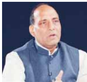
एजेंसी। नई दिल्ली

गृह मंत्री राजनाथ सिंह ने आज राज्यसभा में कहा कि हाल ही में जारी राष्ट्रीय नागरिक रजिस्टर (एनआरसी) के दूसरे मसौदे को लेकर कुछ लोग डर का माहौल पैदा करने की कोशिश कर रहे हैं वहीं निहित स्वार्थ वाले लोग सोशल मीडिया पर दुष्प्रचार कर रहे हैं ताकि देश में सांप्रदायिक सौहार्द्र को बिगाड़ा जा सके तथा मामले का अंतरराष्ट्रीयकरण किया जा सके। आश्वासन दिया कि एनआरसी प्रक्रिया को पूरा करने के लिए सरकार प्रतिक्रम है तथा इसमें किसी के साथ भेदभाव नहीं किया जा रहा है।