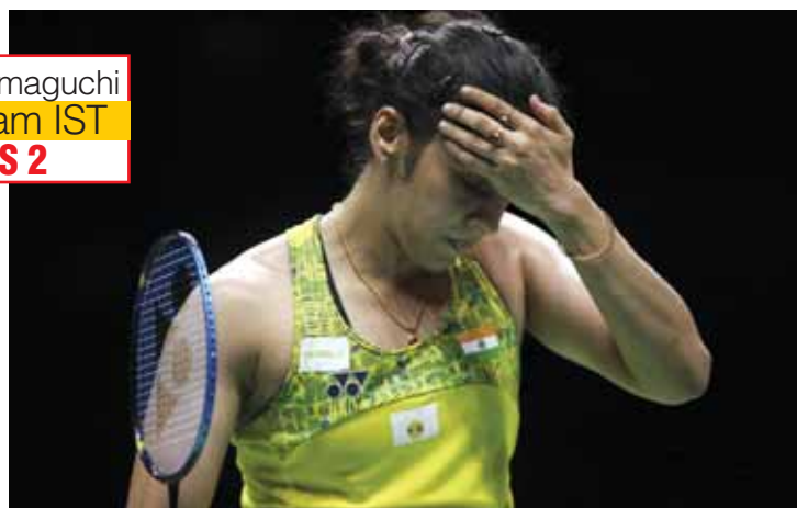
Saina Nehwal reacts as she competes against Carolina Marin in their women's singles quarterfinal