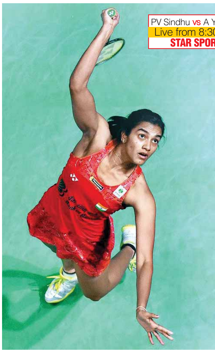
PV Sindhu vs A Yamaguchi Live from 8:30am IST STAR SPORTS 2